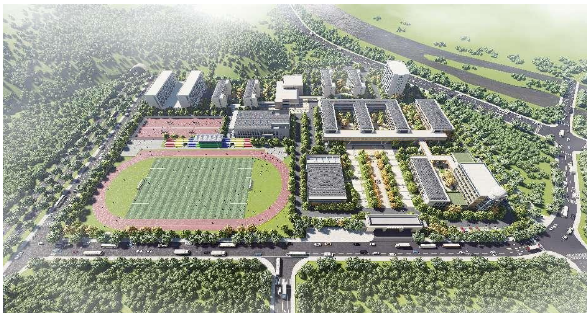
图 16 扩建工程效果图

2024 年 4 月，县委、县政府对全县教育资源进行整合，决定实施庆元县职业高级中学职业教育高质量发展提升工程，实施一校两区办学模式。菊隆校区投资 1.128 亿新建实训楼和教工宿舍楼目前已基本完工。2025 年，县里又启动了总投资 6370 万元庆元校区建设项目，拆除北区教学楼和高三教学楼，新建一幢 16 个教室的教学楼，对现有建筑、田径场、篮球场进行改造翻修，校内道路白改黑，同时，对部分教学实训设备进行更换，实施空调进寝室工程。目前，庆元校区项目各项工程稳步推进，预计将于 2026 年 11 月完成建设任务。