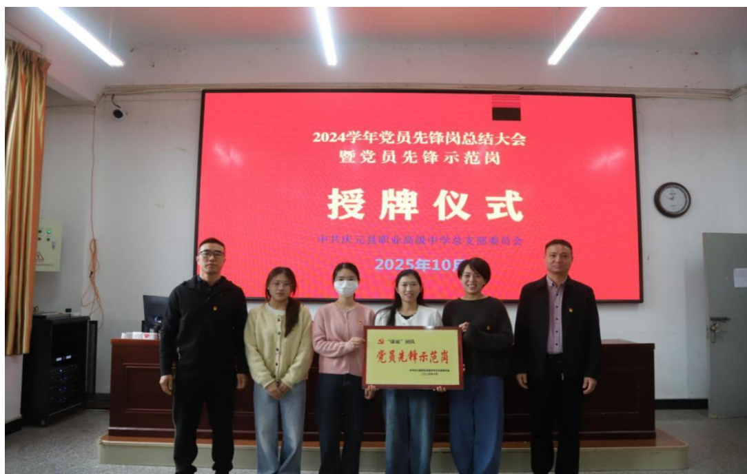
图 14 党员先锋岗授牌

中全会精神、浙西南革命精神，严格落实“三会一课”制度，强化使命担当与群众观念，营造风清气正、担当实干的育人氛围。