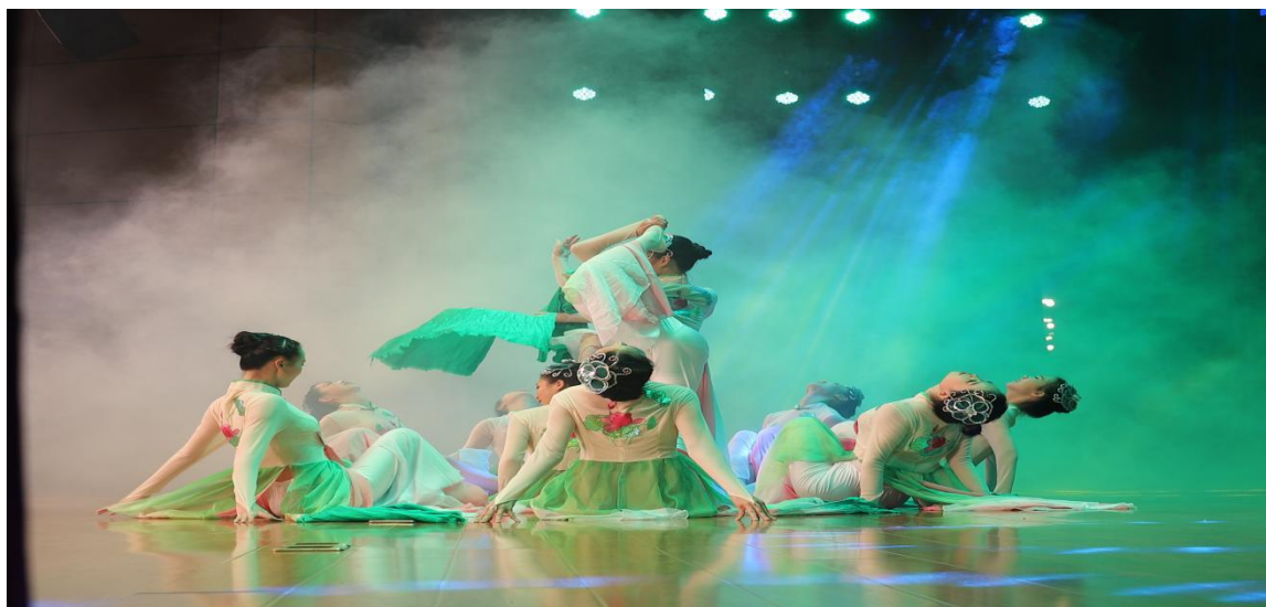
图 5 精彩丰富的学生活动