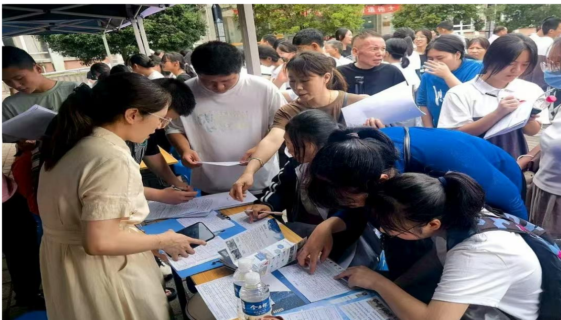
图 12 校企人才洽谈会

健全实习管理体系，推动专业实习与职业成长深度融合。健全实习管理体系，推动专业实习与职业成长深度融合。学校成立以校长为组长、各相关处室负责人组成的实习就业工作领导小组，明确职责分工，提前规划实习安排，持续完善实习管理制度与流程。学校坚持以学生专业特点与个人发展意愿为导向，安排学生进入对口企业开展岗位实习，帮助学生在真实职业场景中深化专业认知、锻炼实践能力。