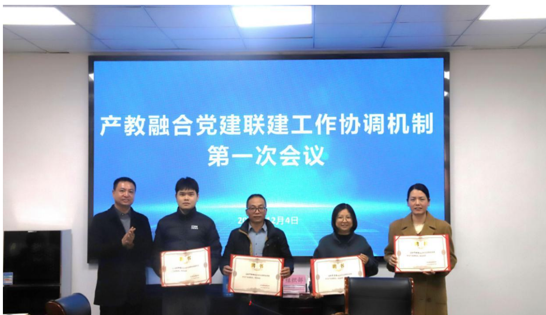
图 11 聘请产业副校长

深化政校行企协同，构建产教融合发展新格局。2025 年 12 月，学校与县教育局、人社局、经商局、经开区及党校等单位，共同成立政校企协同工作协调机制，并召开首次联席会议，同步聘任相关部门负责人担任“产业副校长”，合力推动职业教育与县域产业深度融合。学校制定《政校企合作实施方案》，秉持互利共赢、平等协商、资源共享原则，通过搭建校企互通平台、设立企业宣传窗口、共办技能赛事、合作开发课程与教材等途径，持续完善长期稳定的合作体系。截至目前，学校已与 19 家企业建立稳固合作关系。