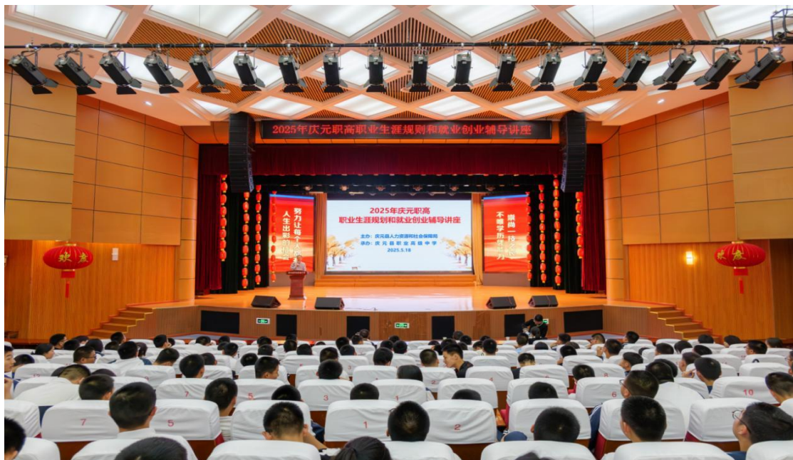
图9 职业生涯规划指导