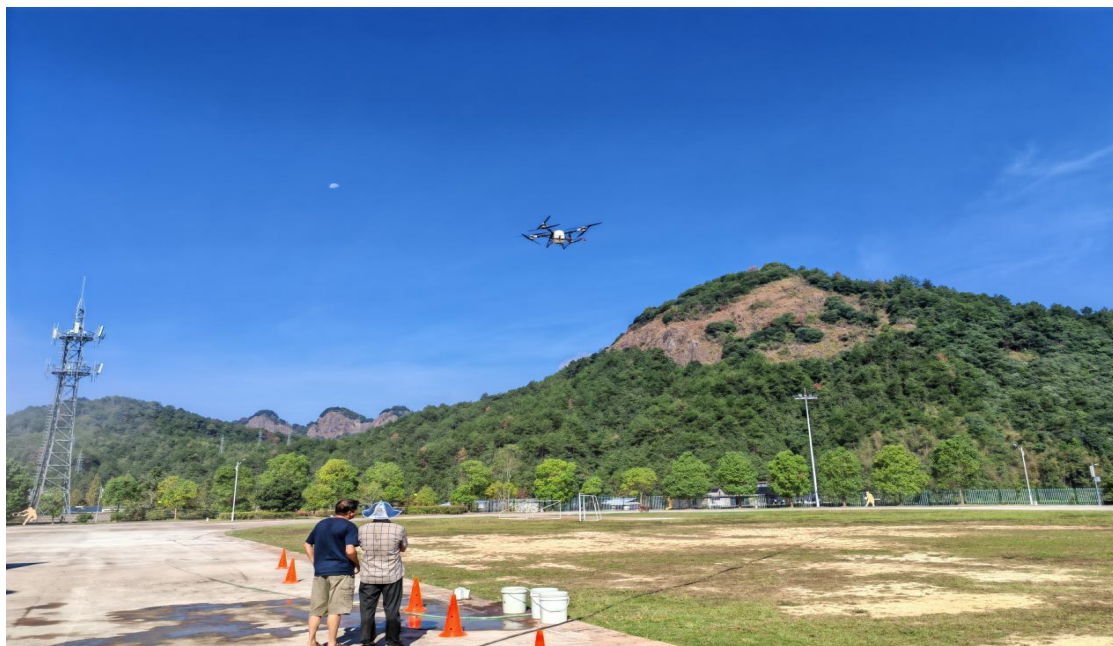
图 7 开展植保无人机培训

航拍无人机驾驶员（中级）、巡检无人机驾驶员（中级）等 3 个工种 4 个班次 149 人次的中高级职业技能等级证书培训；开展了植保无人机驾驶技术、食用菌栽培技术等 2 个专业 2 个班次 98 人次的农村实用人才技术培训班；另外开展了红十字救护员证、电工操作证等 17 个批次 2748 人次的合格证培训；参与协办 2025 年庆元县第七届“菇乡工匠”职业技能大赛物联网安装调试员竞赛和品酒师竞赛的赛前培训和大赛组织工作，为县域经济社会发展提供了稳定技能人才支撑。通过主动对接县域重点产业、破解企业技术难题、搭建人才供需平台，系统推动教学资源向产业服务能力转化。过去一年，学校组织师生深入产业一线开展服务活动 13 次，重点参与“竹口洋源‘以竹代塑’共富产业园”和“大坑口香菇共富产业园”的建设与生产实践，在新型菇种栽培试验与推广中提供技术支持，并协助地方开展特色香菇 IP 的打造与推广工作，有效助推区域特色产业提质升级与品牌化发展。