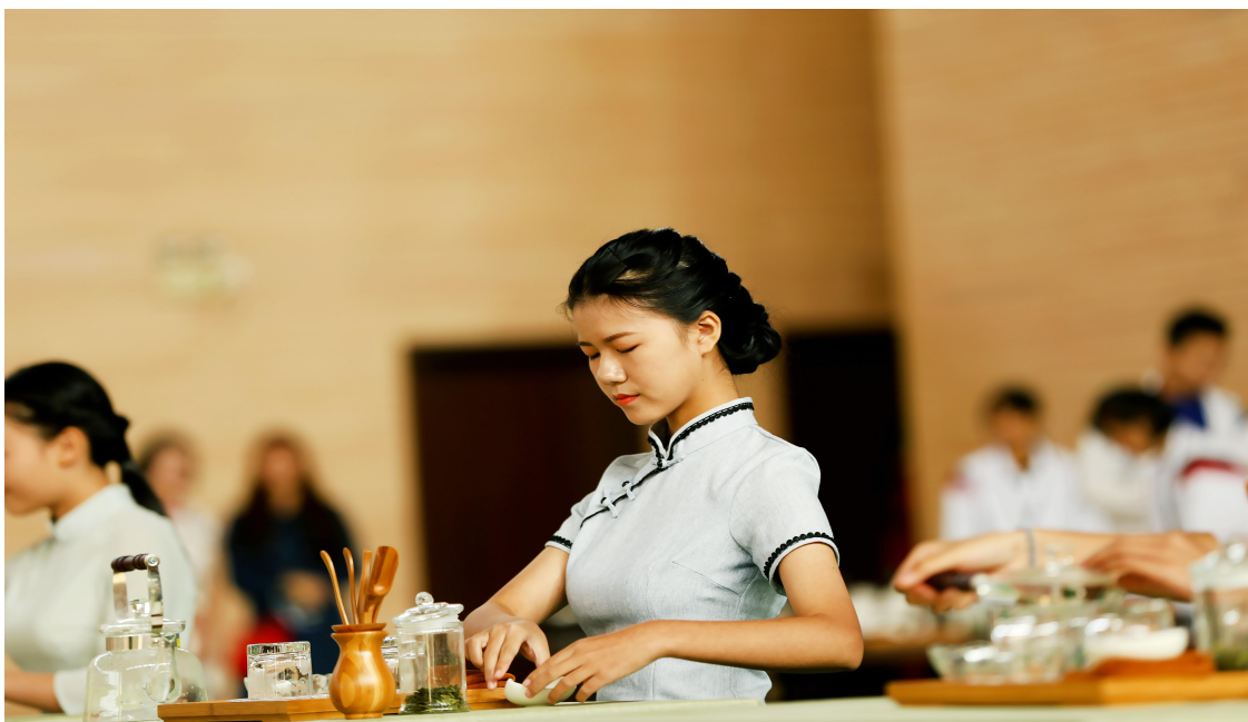
图2 学生技能展示活动