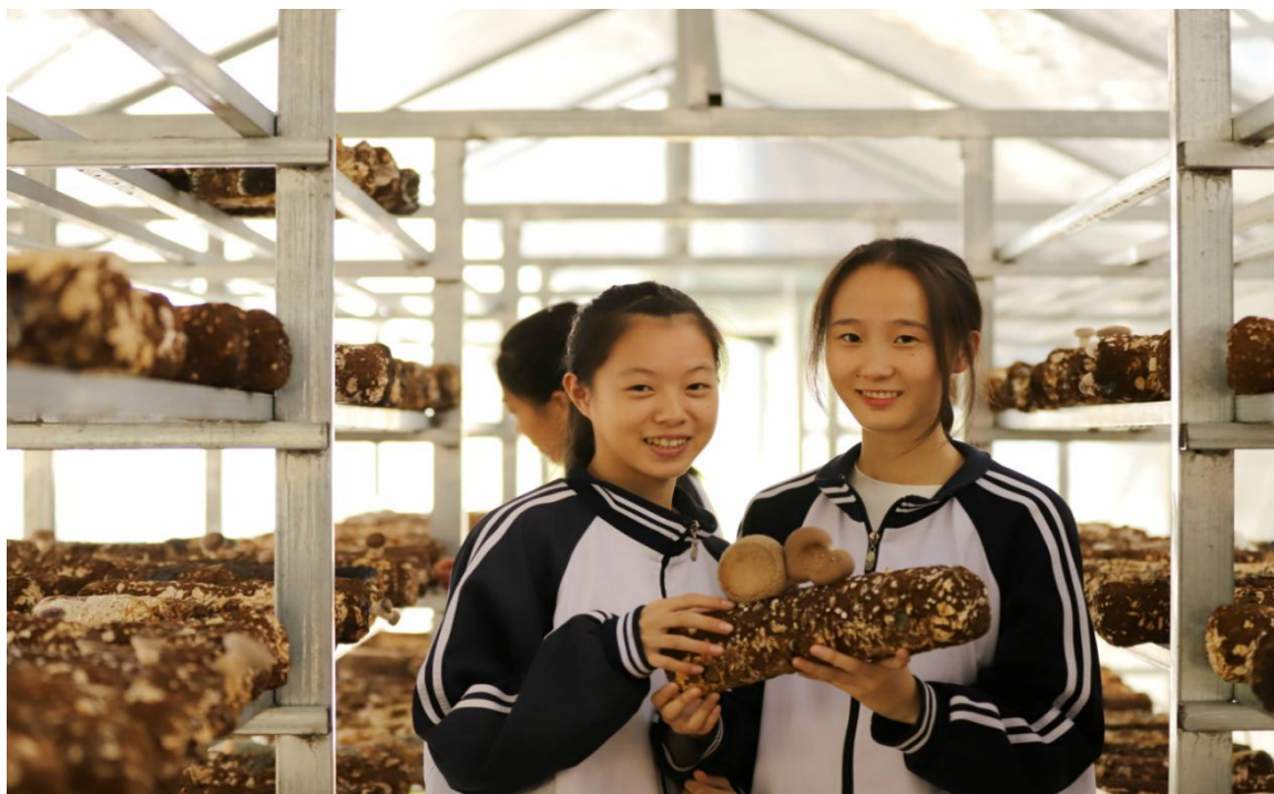
图 3 喜获丰收

生技能大赛中，我校学生获得各类一等奖 21 人，二等奖 31 人，三等奖 74 人，获奖总量较上一学年实现显著增长，以赛育人成效稳步彰显。