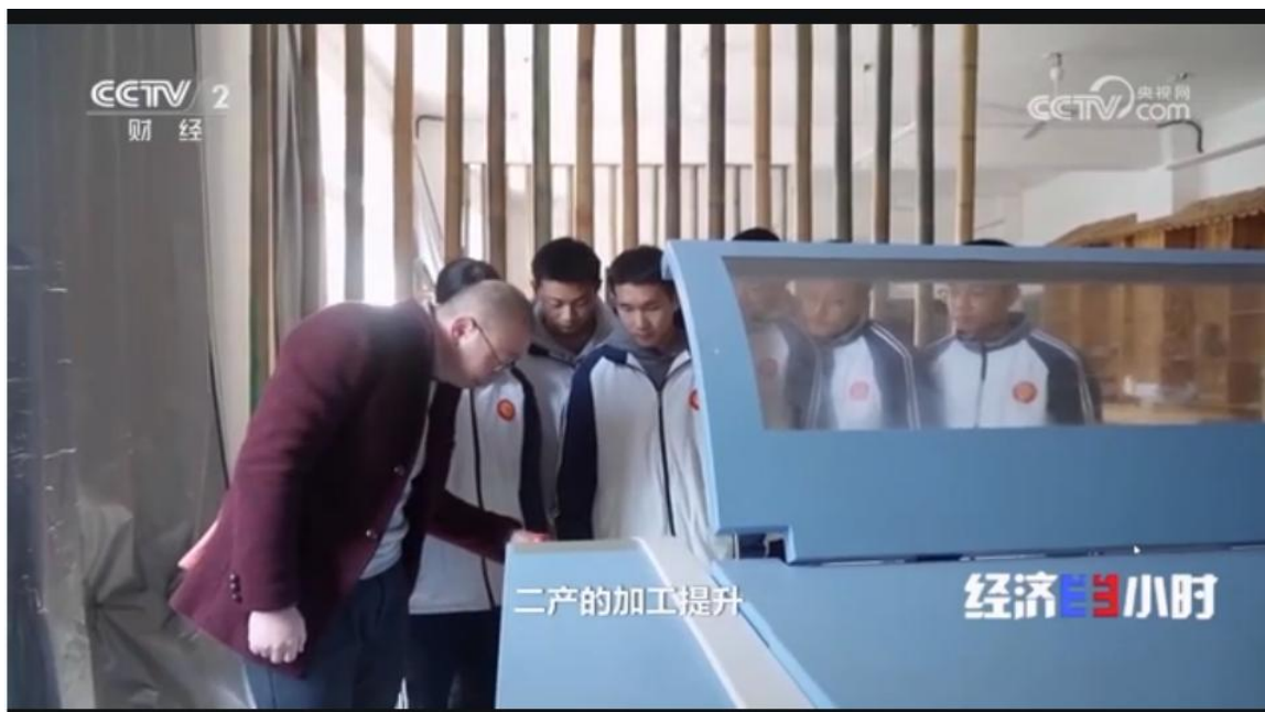
图 6 学校做法被央视《经济半小时》报道

作为全国现代竹产业产教融合共同体常务理事单位，学校联合浙江农林大学、丽水职业技术学院及本地企业开展产教融合活动 5 次，推动校企研深度联动。2025 年，学校组织实施职业技能等级认定 2 批次，参与 164 人次，162 人获证，获证率达 98.8%，有效拓宽了技能人才成长通道。竹制品专业师生利用自身所学，参与地方产业发展，助力乡村振兴的做法也被中央电视台《经济半小时》栏目报道。