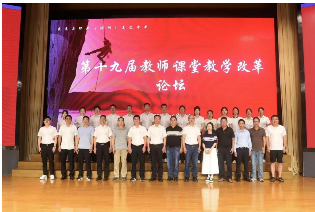
图 15 教学改革论坛活动

三是发挥骨干示范作用。实施教师“追梦”系统培养工程，围绕寻梦、启梦、筑梦、逐梦、圆梦五个发展阶段，对标“四有好老师”标准，逐步培育具有教育家精神的优秀教师。2024 学年，学校新增市教坛新秀（德育新秀）3 人、教坛新苗（德育新苗）4 人，1 人通过市教学名师复评，名优教师梯队持续壮大。