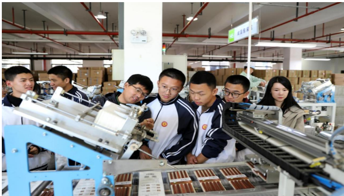
图 13 学生企业实习活动

通过系统化、差异化的实习安排，学生不仅在专业技能上取得显著进步，更深入理解企业文化，增强对行业和岗位的认同感，实现从学习到就业的有效过渡。