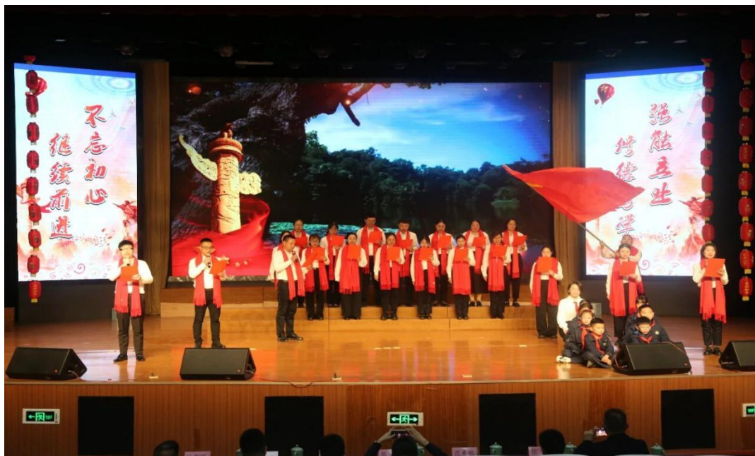
图 10 红色诗歌朗诵比赛